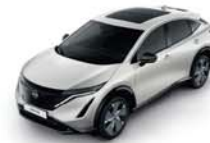
White Pearl -P- QBE