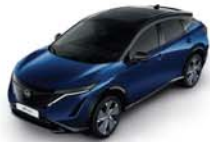
Blue Pearl -P- XGU