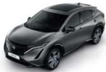
Gun Metallic -M- KAD