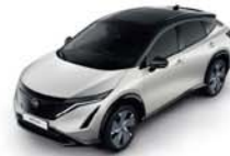
White Pearl -P- XGA