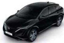
Pearl Black -P- GAT