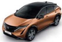
Akatsuki Copper -M- XGJ