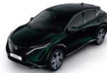
Aurora Green -P- DAP