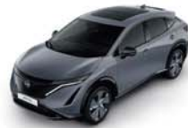
Ceramic Grey -S- KBY